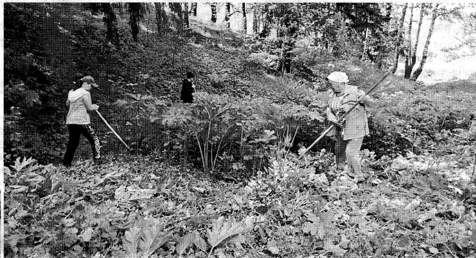
Борьба с борщевиком

Работники администрации активно занимаются регистрацией земельных участков физических лиц. Из имеющихся 1373 участков на сегодняшний день оформлены 1086. Даже пустующие земельные участки на территории населённых пунктов за кем-то числятся. Поэтому необходимо устанавливать правообладателей. Жителям необходимо самим активнее обращаться в МФЦ и на основе свидетельства пожизненного наследова-