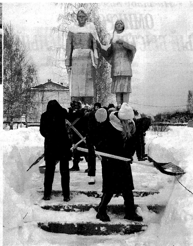
Команда "Морко шўшпык" в действии

Протяжённость автодорог по поселению составляет 36571 м. Из них на балансе ДРСУ – 2273 м., поселения - 34298 м. За отчетный 2021 год был произведен ремонт 1600 м. грунтовой дороги. Из них по проекту поддержки местных инициатив (ПМИ) 800 м. улицы Ленина д. Краснояр и при поддержке правительства РМЭ 800 м. на улице С.Н. Николаева д. Абдаево. Силами жителей населенных пунктов построены новый колодец из железобетонных колец в д. Чавайнур, отремонтирована ул. Заозерная в д. Коркатово, частично - ул. Краснова в д. Краснояр, проведен ремонт водобашни в д. Малый Карамас.