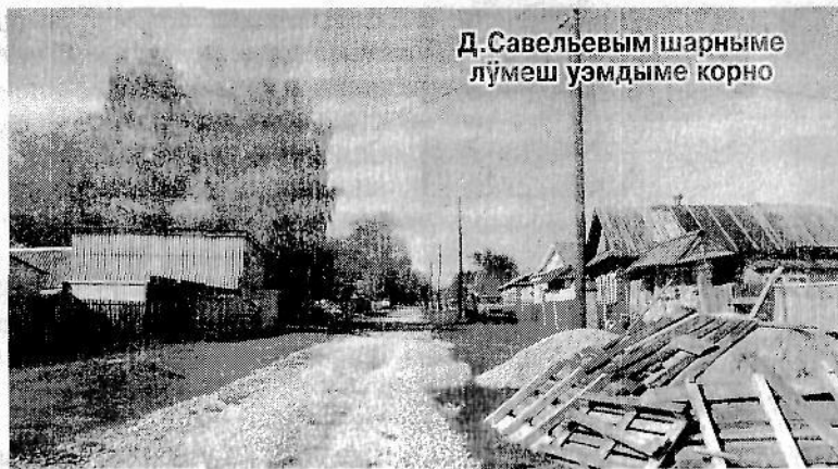
Д.Савельевым шарныме лўмеш уэмдыме корно