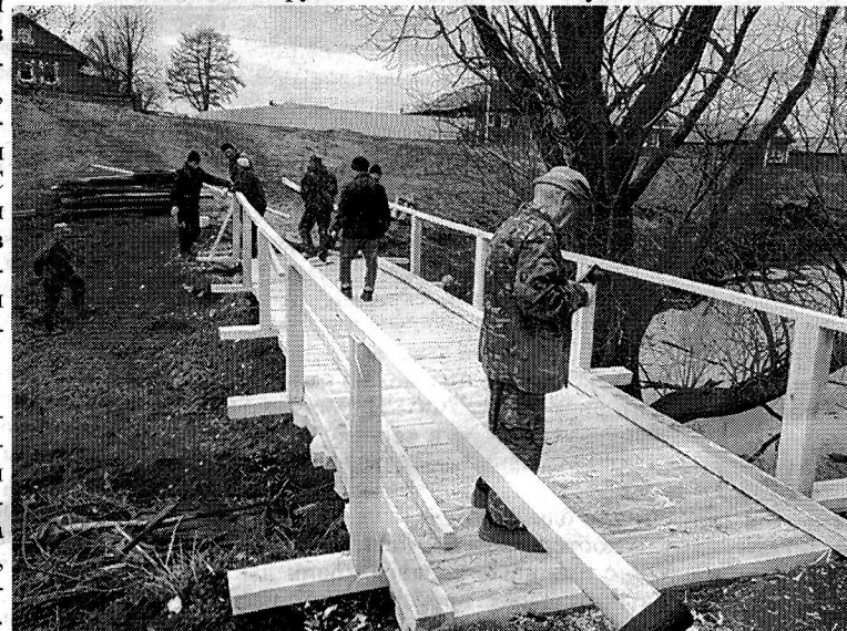
Пешеходная переправа по улице Заречная в с.Шиньша

в зимний период постоянно расчищается от снега. Для этого заключен контракт с СХА «Передовик» на сумму 551980 рублей. Проведена работа по ремонту дороги по улице Советская в с.Шиньша, проложили новый асфальт протяженностью 0,284 км. Выделены средства из Минтранс в сумме 1 млн. рублей, также из дорожного фонда района 595 тыс.рублей. На продолжение этой же дороги протяженностью 0,12 км выделены средства Главы Республики Марий Эл в сумме 800 тыс.рублей. Также отремонтировали подъезд к деревне Новый Юрт за счет дорожного фонда района на сумму 129307 рублей.