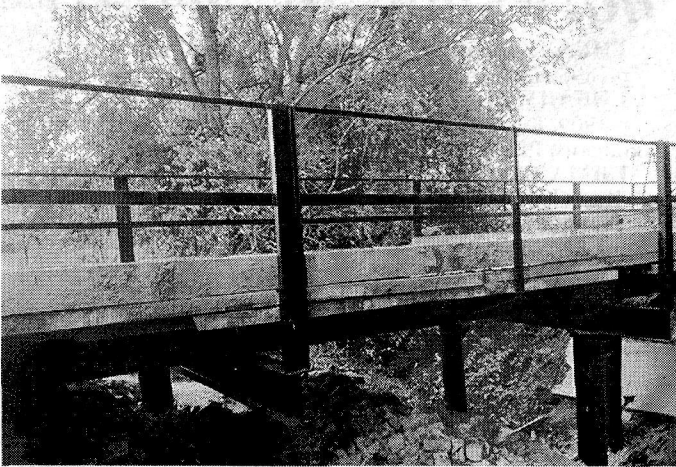
«Мост предков-Тукым кувар» по проекту местных инициатив в с.Шиньша по улице Колхозная

министрацией обеспечивалась законодательная деятельность Собрания депутатов сельского поселения. Специалистами администрации разрабатывались все нормативно-правовые документы, которые предлагались вниманию депутатов на рассмотрение и утверждение. В течение 2021 года Собранием депутатов проведено 6 заседаний третьего созыва, на которых рассмотрено и принято 123 правовых акта, часть из которых прошла процедуру обна-