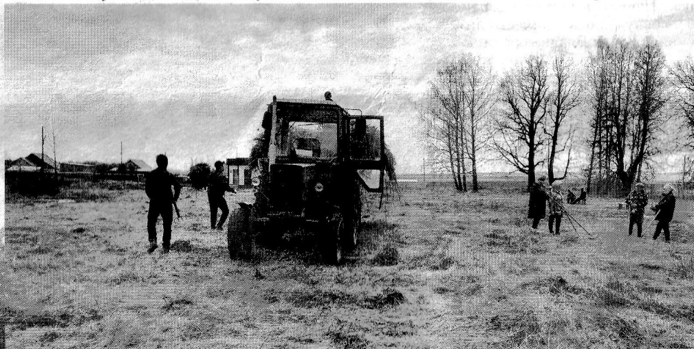
Благоустройство священной роши в д.Большие Шали

По программе «Благоустройство» на капитальный ремонт основного здания Кумужьяльской школы из федерального бюджета было выделено 5525381,35 рублей. Также произвели ремонт пищеблока