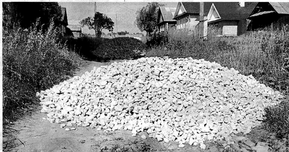
Ямочный ремонт дороги в д.Вонжедур

В тесном сотрудничестве со специалистами администрации проводится обследование жилищно-бытовых условий одиноко проживающих и малообеспеченных пенсионеров, оказывается консульта-