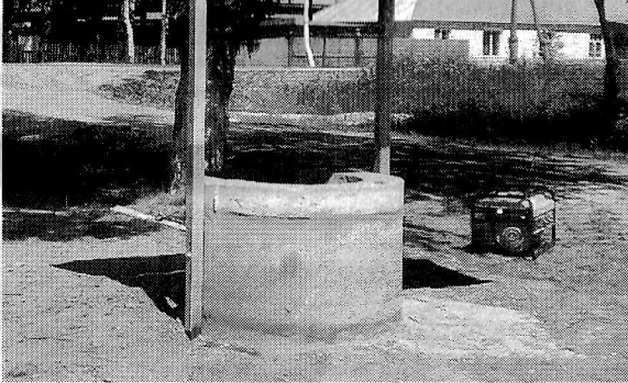
Колодец в д.Тыгды Морко

Согласно составленному графику проведения собраний граждан в 24 населенных пунктах за год проведено 25 собраний. В них рассматривались вопросы противопожарной безопасности,