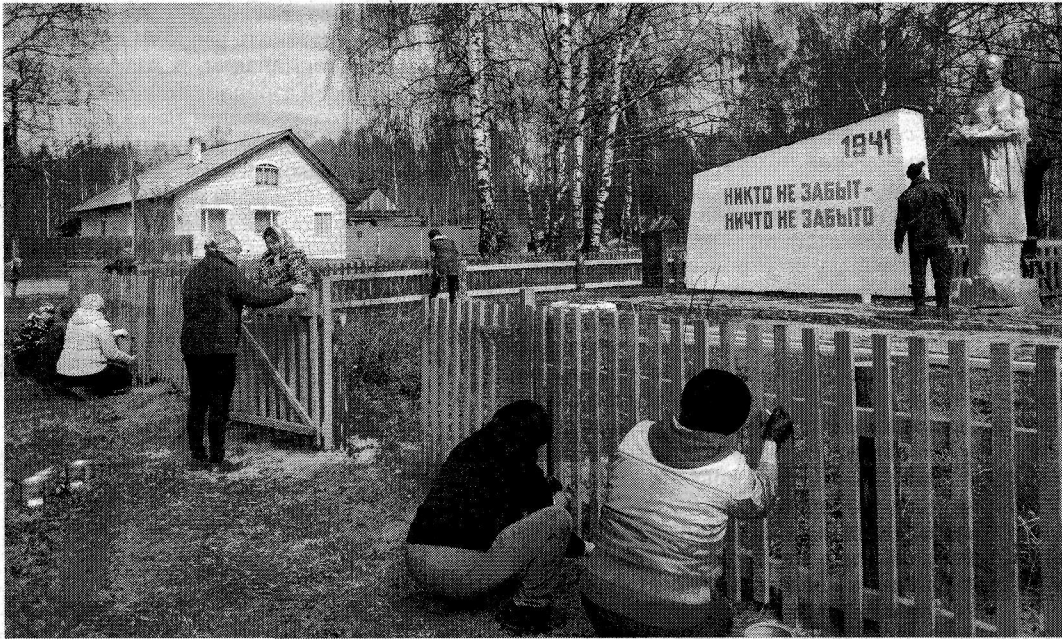
Ремонт забора вокруг обелиска в д.Себеусад

В деятельность администрации поселения входит осуществление воинского