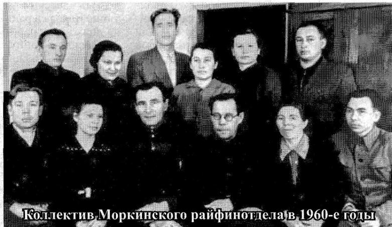
Коллектив Моркинского райфинотдела в 1960-е годы

На 1 января 1925 года были 32 школы первой ступени с 1816 учащимися и 46 учителями, две школы-семилетки (Аринская и Моркинская) с 428 учащимися и 13 преподавателями, Моркинская столярно-токарная мастерская, Моркинский детский дом, одна библиотека, 16 изб-читален и один клуб.