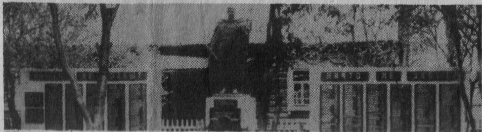
Памятник не вернувшимся воинам-землякам с фронтов Великой Отечественной войны в д. Изанкугур.