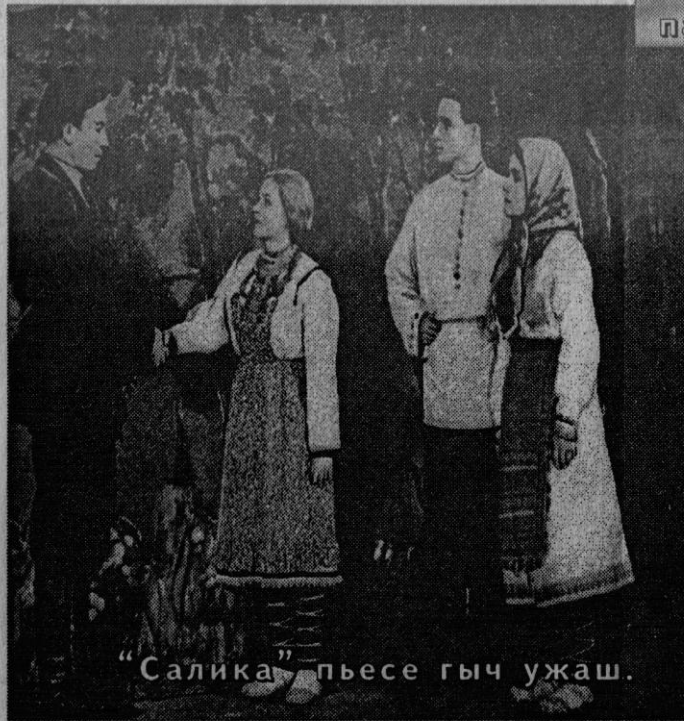
"Салика" пьесе гыч ужаш.

1935-ийыште марий радион йодмыж почеш Морко сўан нерген инсценировкым ямдылен. Тудым "Кўрылтшў сўан" манын лўмден. Варажым у шонымашыже лектын: сўан темылан пьесым возаш да театрыш пуэн ончаш. Пьесын первый вариантше "Полатовын сўанже" лўм дене шочын. Спектакльым шындаш режиссер Алексей Иванович Маюк-Егоровлан ўшанен нуат. Но спектакль шындалтде коदेश, икмыняр замечанийлан кўра. 1937 ийыште пьесысе образ-влакым угыч тўрлатен, виянгден, ончен лекмеке, "Полатовын сўанже" олмеш кок тулык рвезе енын йўратымашышт да