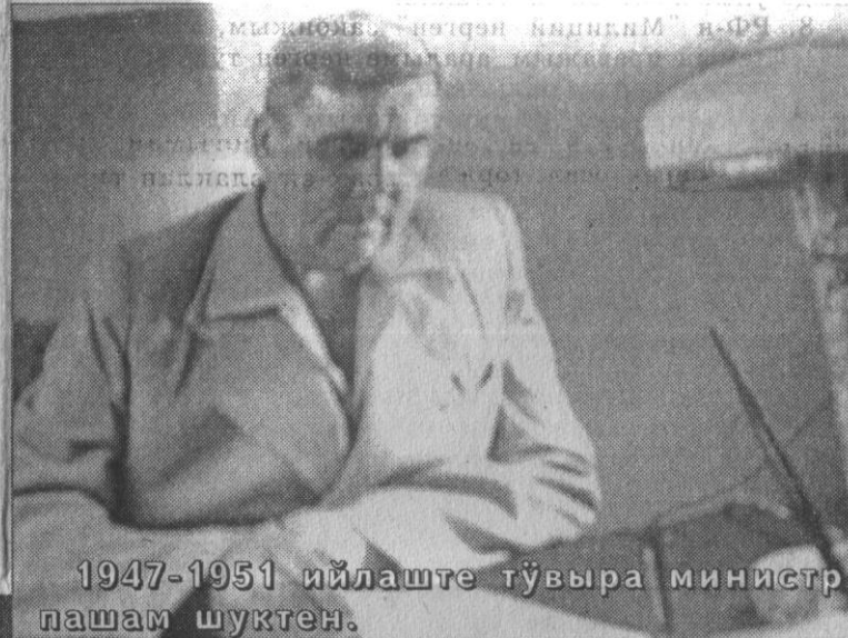
1947-1951 ийлаште тўвыра министр пашам шуктен.

Салика - марий ўдырамашым иктешлен ончыктышо типический да поэтический образ. Пьесыште чыла действий Салика йыр пўрдеш, тудо тўн фигура. Тудо калыкын реальный или-