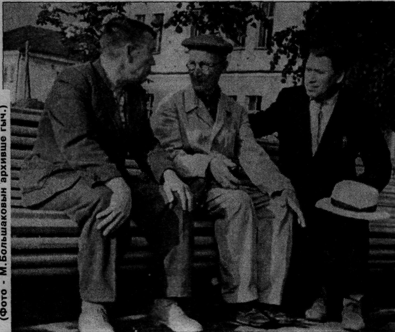
(Фото - М. Большаковын архивше гыч.)

Тудо койдарчык почеламутым да басным возышо семынат палыме. Посна книга дене "Курезе да Кармыванго" сборникым луктеш. "Шондык тич поянык" мыскара книгагат марий