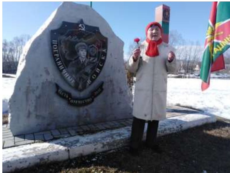
Митинг, посвящённый подвигу пограничников на острове Даманский, проведённый 15.03.2020г.