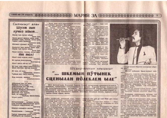
Марий Эл, 1998 ий, 29 апрель

Адрес электронной почты: semisolabib@yandex.ru Группа ВКонтакте Семисолинская сельская библиотека https://vk.com/club100150899