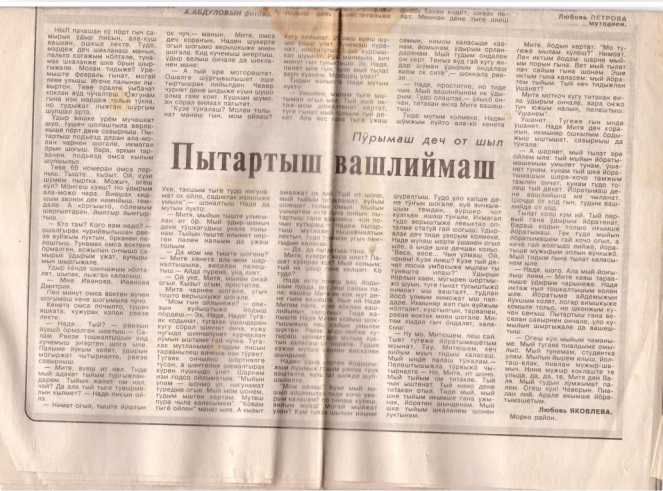
Марий Эл, 1998 ий, 20 май