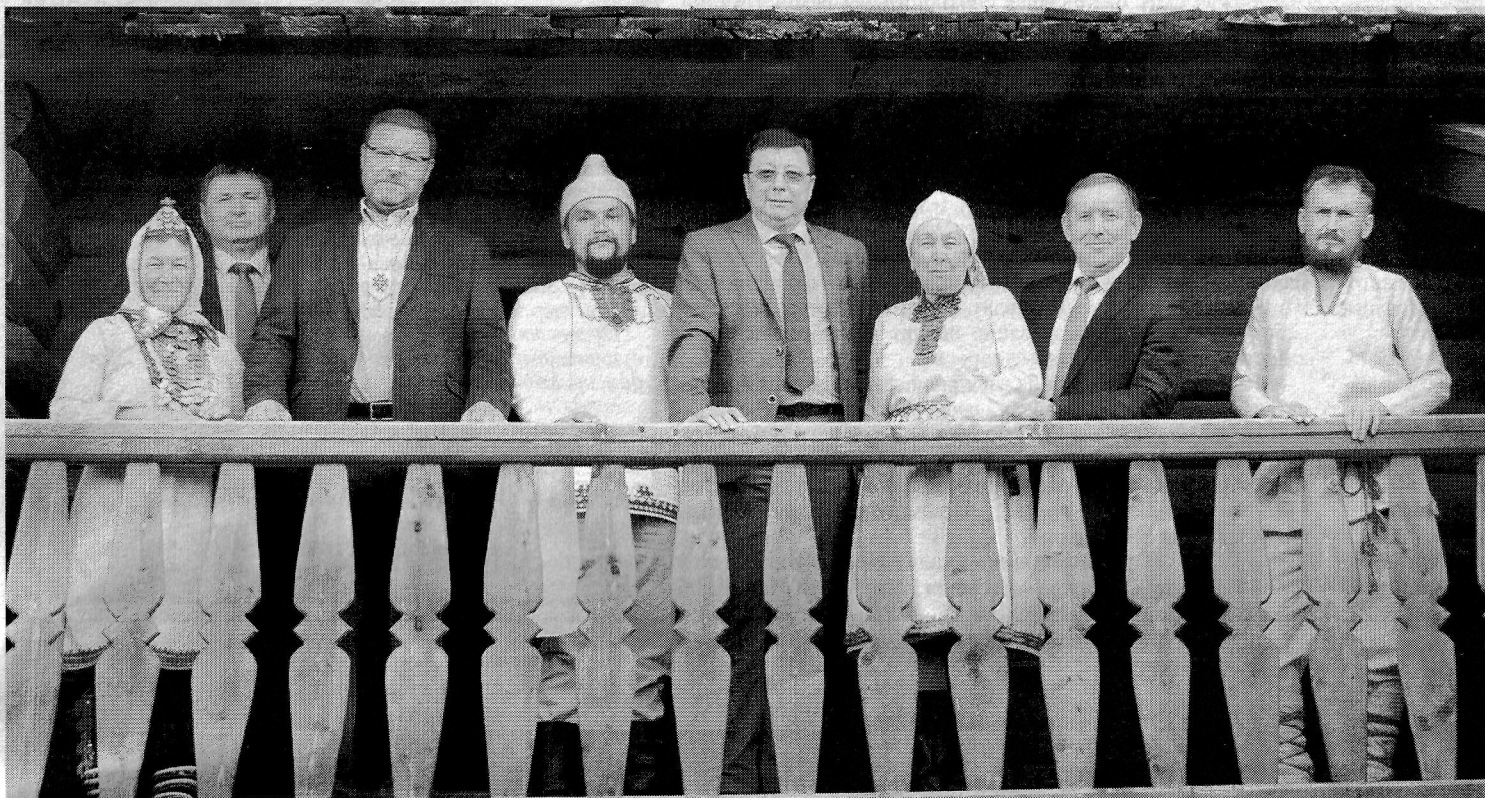
Во время посещения с.Шорунья